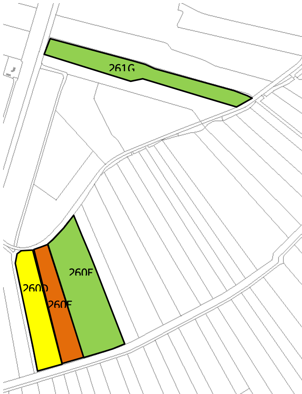
Legenda maai,- en weideregime